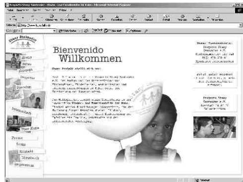
Das neue Internetportal: www.kuba-hilfe.de

auf der anderen Seite kann man sich aber auch schnell und ohne Umwege über spezifische Themen informieren.