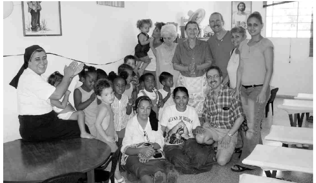
Die Kindertagesstätte der Santa Barbara Gemeinde in Páragas

Den Fortbestand der KITA in Páragas soll sicher bleiben - Neubau eines Gemeindezentrums in Planung