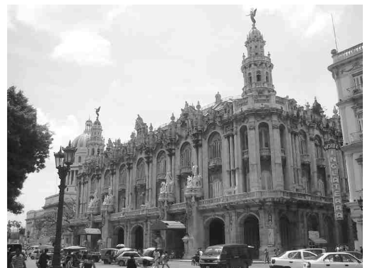
Das Nationaltheater von Havanna „Garcia Lorca“

Für das nächste Jahr ist die Durchführung einer diesbezüglichen Studienreise geplant