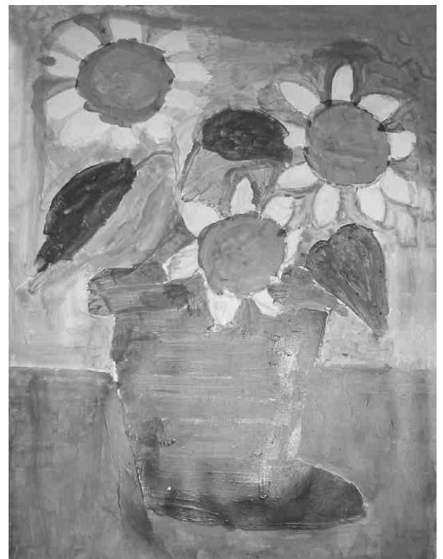
"girasol" / 20x29 (acrílico)

Spenden-Angebote sind zu richten an Proyecto Stany Santander, Stichwort: Yoel.