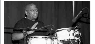
War mit dabei: „Mandingo“

Infos unter: www.ella-y-ellos.de . Schon beim Soundcheck kam Riesenstimmung auf. Als es dann losging, hielt es niemand mehr auf seinen Plätzen. Bei coolen Drinks und bester Partylaune wurde zu heißen kubanischen Rhythmen bis zur letzten Zugabe getanzt. Spezieller Dank gilt dem HCH, der bestens dafür gesorgt hat, dass alles reibungslos abließ. Der Reinerlös kommt zu gleichen Teilen dem HCH und dem Projecto Stany Santander zugute.