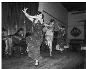
Flamenco im Centro Andaluz

Unter anderem soll Ende des Jahres ein Kulturprojekt zum